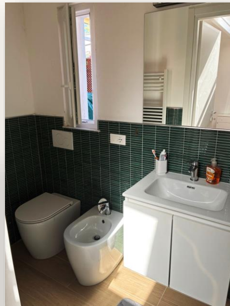
Primeiro banheiro com bidê e ducha