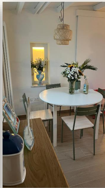
Mesa de Jantar