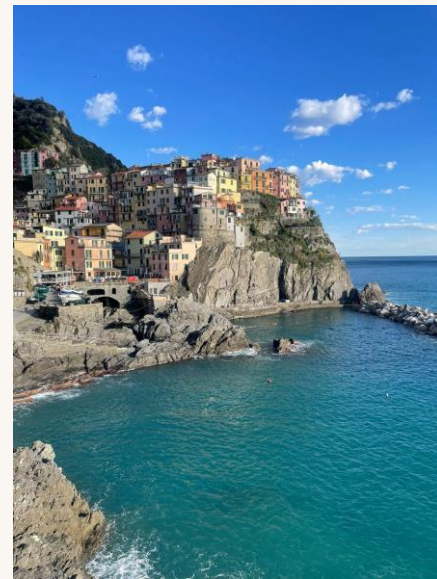
Cinque Terre — 1 hora de trem