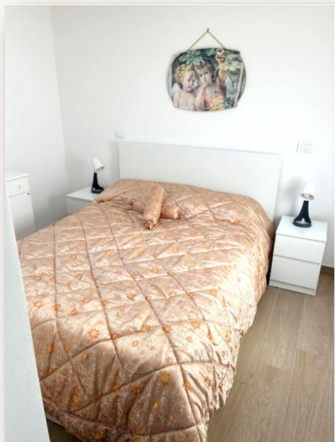
Quarto principal com cama de casal, luminárias de cabeceira, armário e duas mesas de apoio