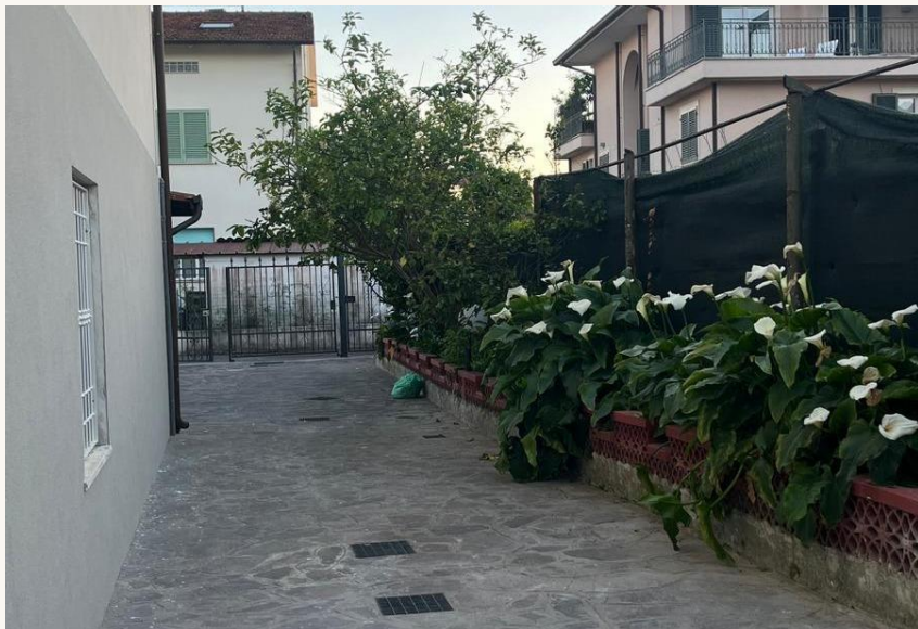
Entrada - Jardim Privado

A cidade preserva um clima autenticamente italiano. Praias incríveis, ótimos restaurantes de frutos do mar, gelaterias tradicionais que existem há gerações e uma feira semanal cheia de produtos locais dão o ritmo da vida por aqui. Da Villa Capasso, tudo pode ser feito a pé ou facilmente explorado com a bicicleta disponível.