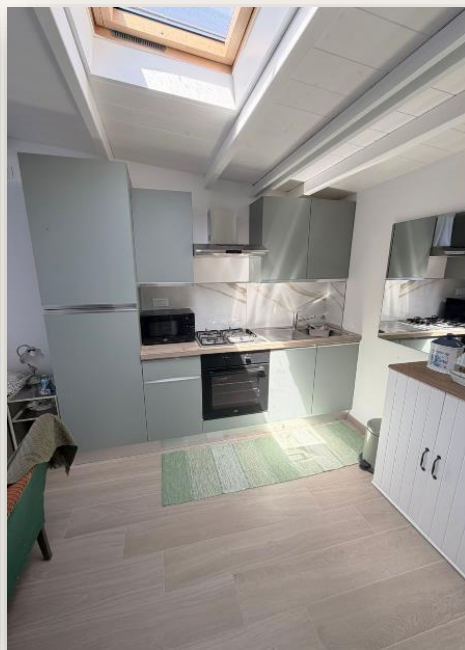
Cozinha com ampla claraboia