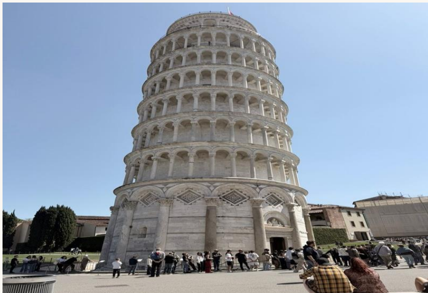
Pisa — 30 minutos de trem

A cidade litorânea em si oferece a autêntica vida italiana: rituais de café expresso pela manhã, aperitivos ao pôr do sol e um dia a dia tranquilo, perfeito para descansar. É esse equilíbrio — destinos espetaculares ao alcance e um refúgio tranquilo— que torna a Villa Capasso um ponto de partida ideal para explorar a Toscana e além.