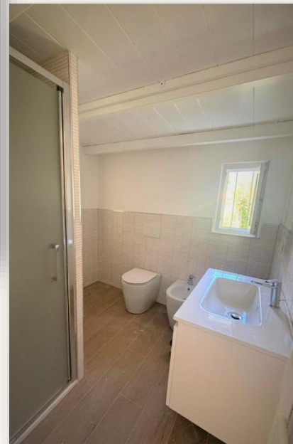
Segundo banheiro com bidê, ducha e maquina de lavar roupa