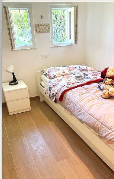
Segundo quarto com cama de solteiro e segunda cama retrátil